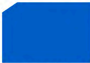
Light blue / Azul claro