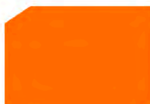
Orange / Naranja