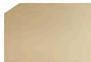
Champagne / Champaña