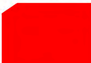
Red / Rojo