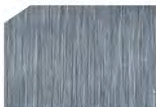
Brushed silver / Plata cepillado