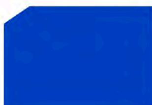
Blue / Azul