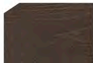
Dark wood embossed / Madera oscura texturizada