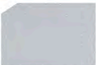
Silver metallic / Plata metálico