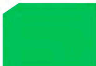
Green / Verde