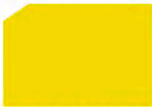
Yellow / Amarillo