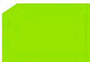
Light green / Verde claro