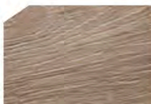
Light wood embossed / Madera clara texturizada