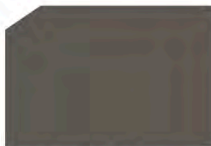
Graphite / Grafito