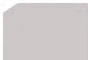
Light gray / Gris claro