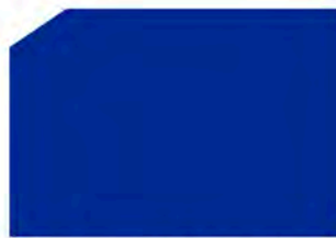
Dark blue / Azul oscuro