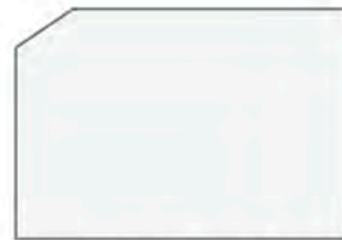
White / Blanco