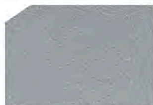
Bright silver / Plata brillante