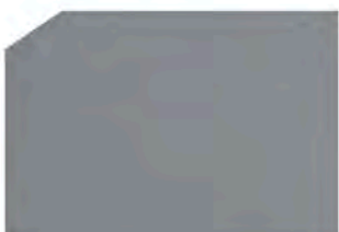
Dark silver / Plata oscuro