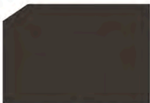
Dark bronze / Bronce oscuro