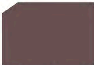
Light bronze / Bronce claro